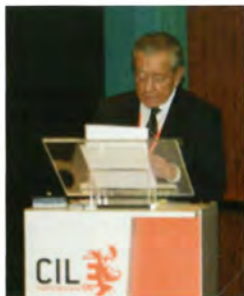
Palabras de don Miguel Alemán Velasco, en la ceremonia de entrega de la Medalla de Oro de la Asociación de Academias de la Lengua Española, San Juan Puerto Rico, martes 15 de marzo de 2016.