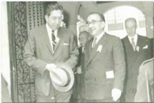
Tercer Congreso de Academias de la Lengua Española, Bogotá Colombia, 1 de agosto de 1960. Don Miguel Alemán Valdés, al término de una de las reuniones efectuadas en Bogotá, en donde presentó su ponencia, que aprobada in extenso, se hizo del conocimiento de la Unesco.