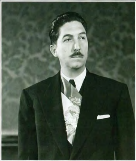
Miguel Alemán Valdés Presidente de México (1946-1952)