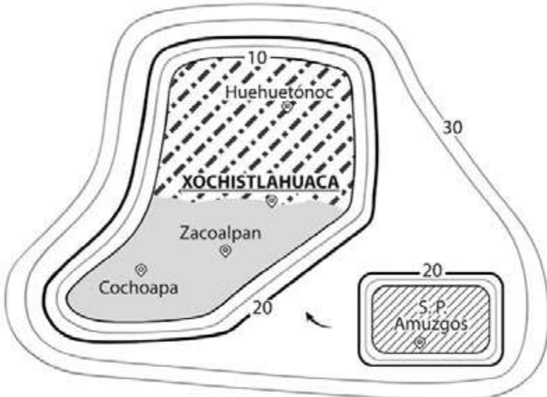
Elaborado por L. Valiñas basado en Eglund et al. (1983: 8). Digitalizado por Fabiola Cruz Zafra.

GRÁFICA 23. Las dos agrupaciones amuzgas , según los resultados de los sondeos sobre inteligibilidad interdialectal del ILV. Los achurados corresponden a los que tiene cada variante lingüística en el mapa 57